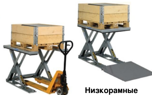
Низкорамные подъемные столы