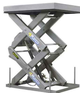
Подъемники большой высоты подъема