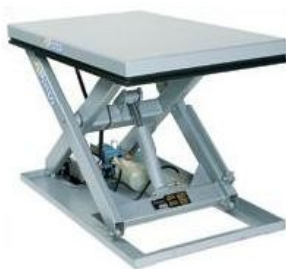
Одноножничные подъемные столы