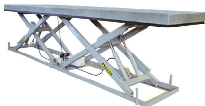
Подъемный стол увеличенной длины (со сдвоенными ножницами)