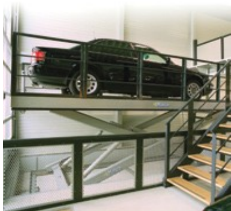
Автомобильный межэтажный подъемник